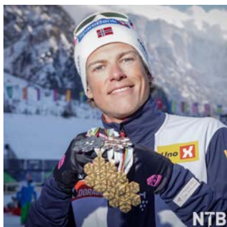
Johannes Høsflot Klæbo